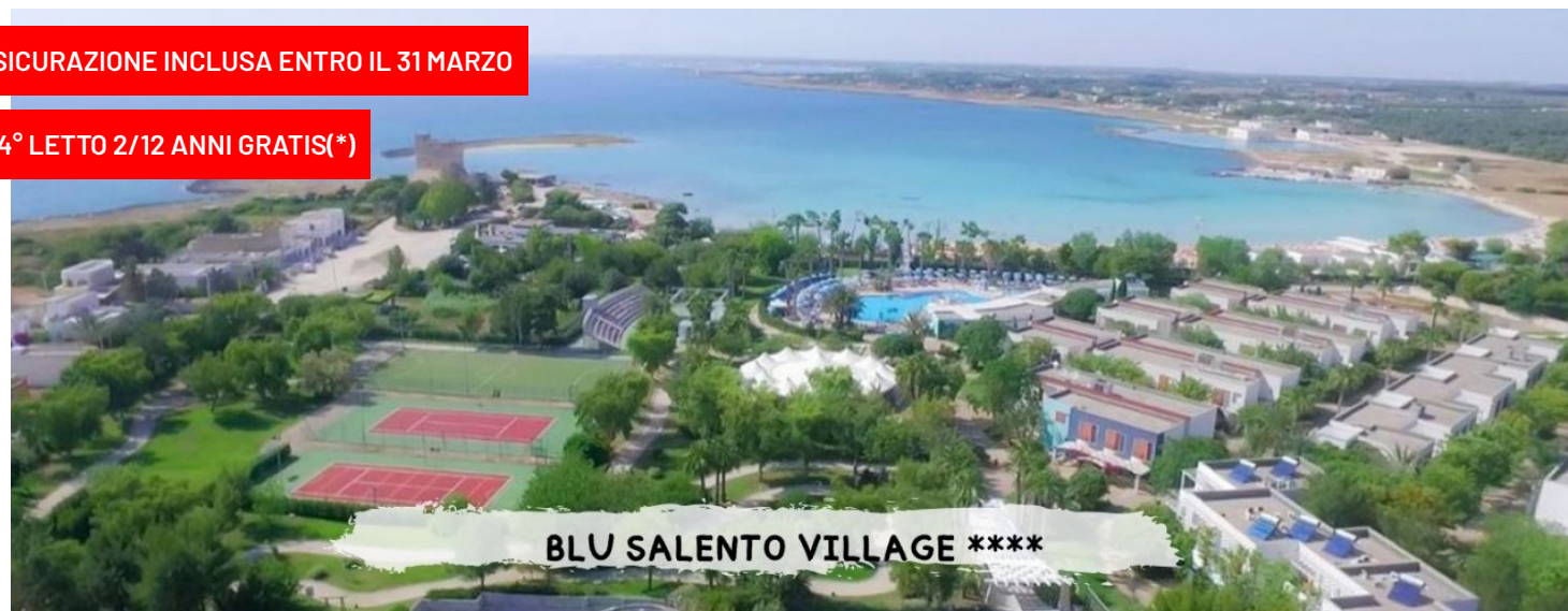
BLU SALENTO VILLAGE ****