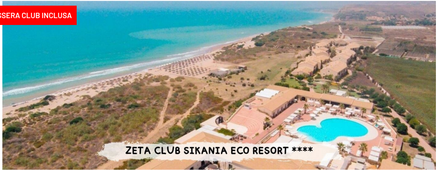
ZETA CLUB SIKANIA ECO RESORT ****