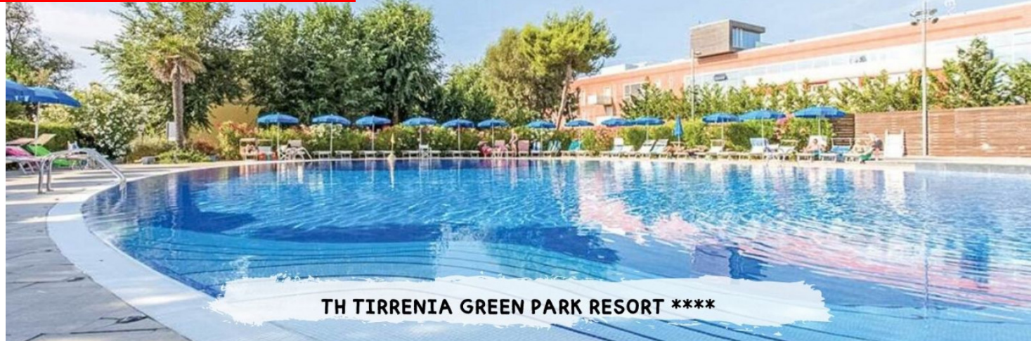
TH TIRRENIA GREEN PARK RESORT ****

PRENOTA PRIMA GARANTITO FINO AL 15 MARZO