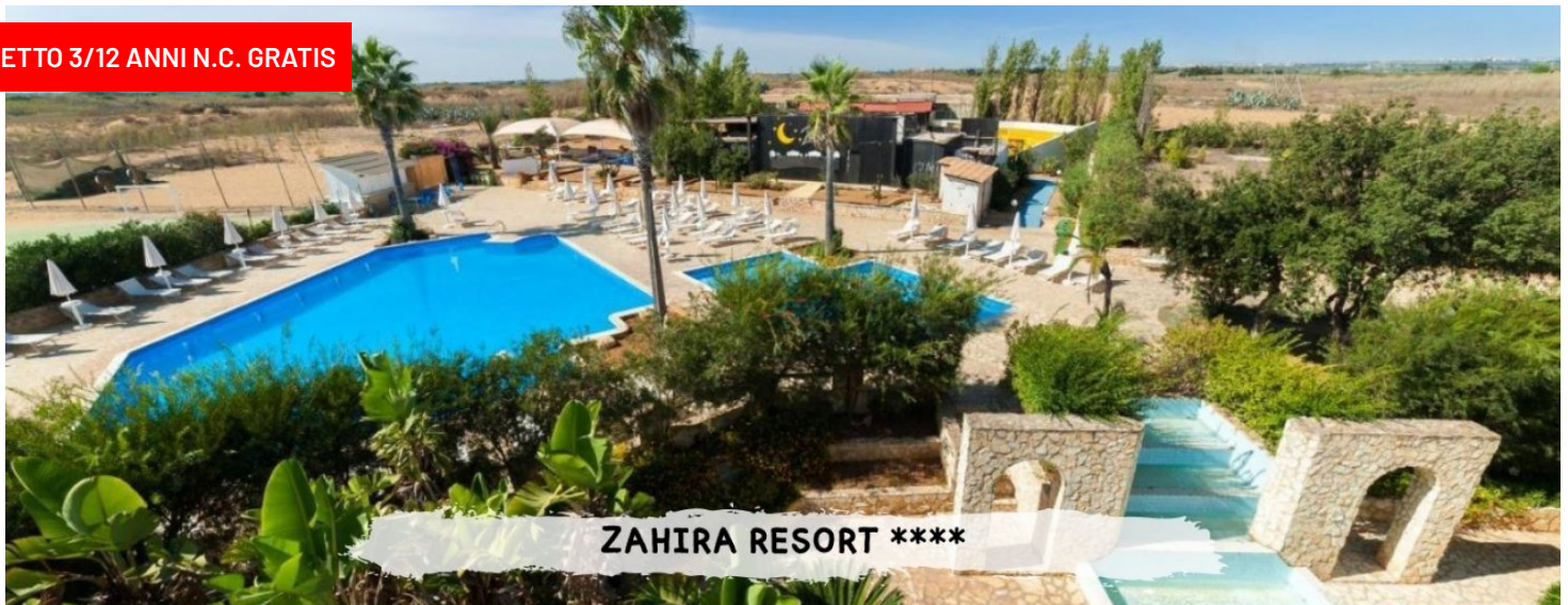
ZAHIRA RESORT ****