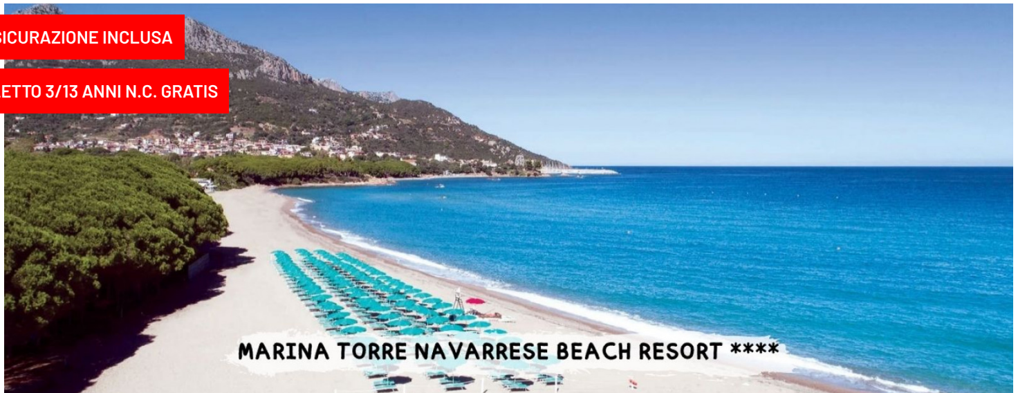
MARINA TORRE NAVARRESE BEACH RESORT ****