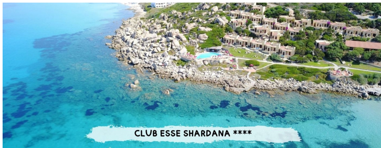
CLUB ESSE SHARDANA ****