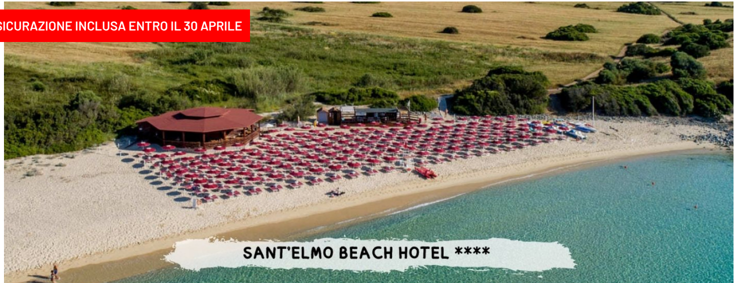
SANT'ELMO BEACH HOTEL ****

ASSICURAZIONE INCLUSA ENTRO IL 30 APRILE