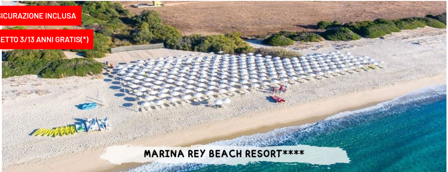
MARINA REY BEACH RESORT****