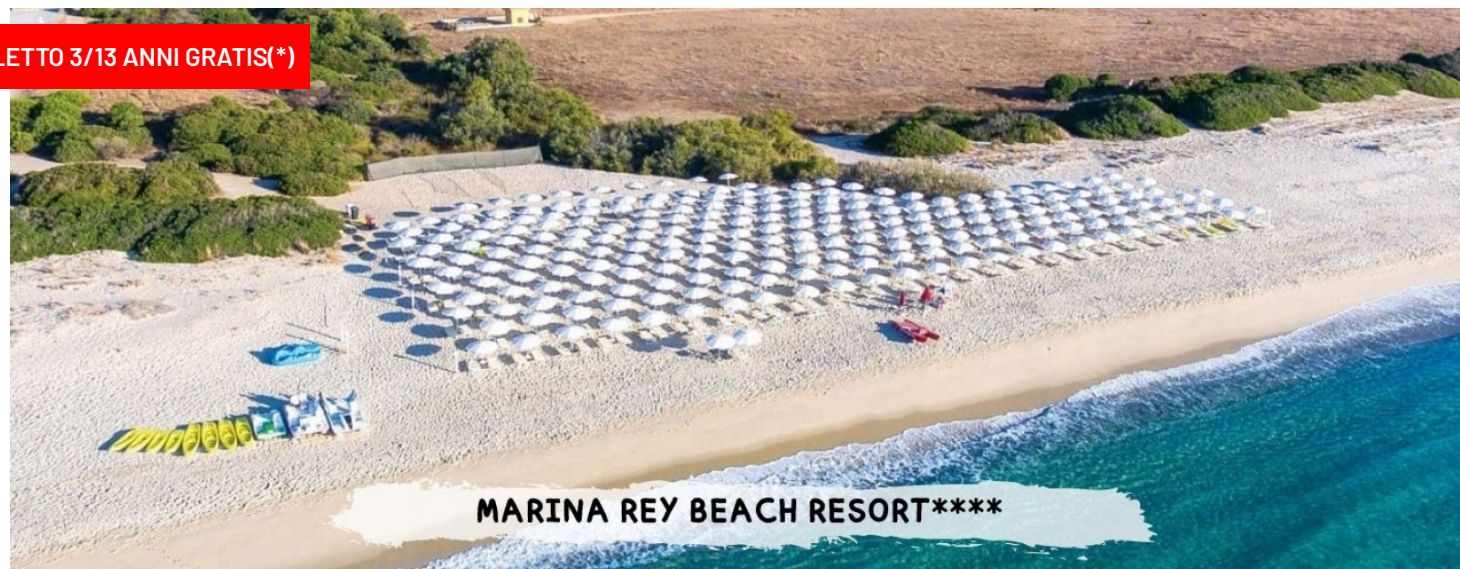
MARINA REY BEACH RESORT****