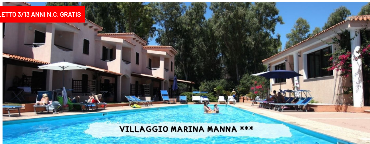
VILLAGGIO MARINA MANNA ***