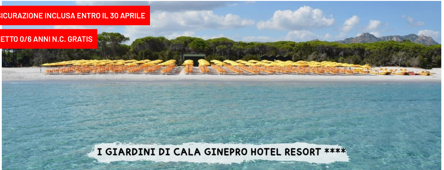
I GIARDINI DI CALA GINEPRO HOTEL RESORT ****