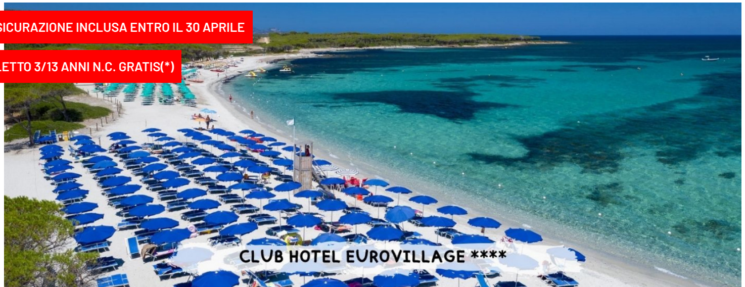
CLUB HOTEL EUROVILLAGE ****