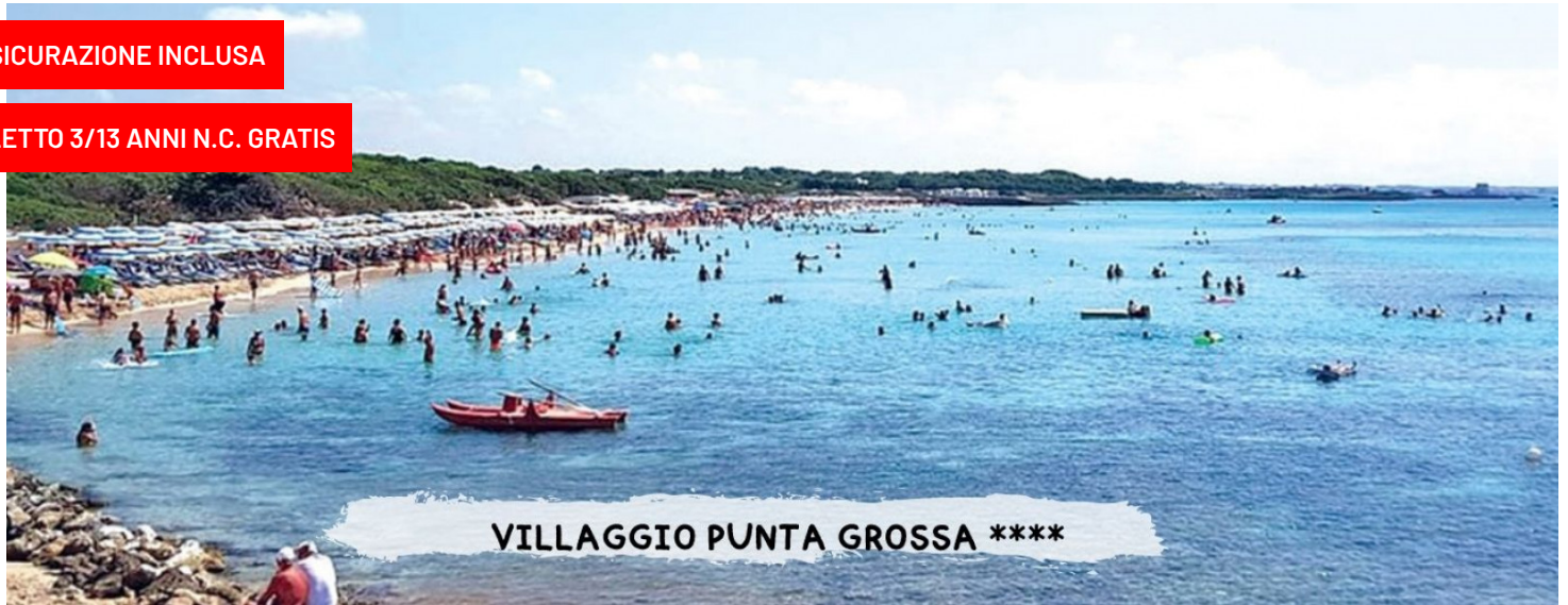
VILLAGGIO PUNTA GROSSA ****