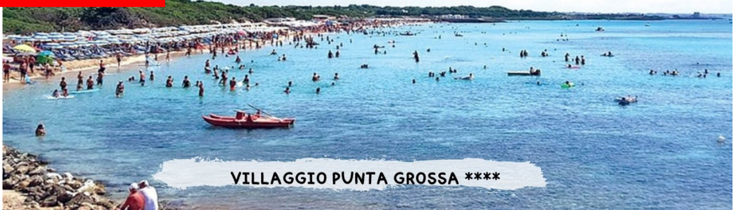
VILLAGGIO PUNTA GROSSA ****

Quote a persona in pensione completa - bevande incluse