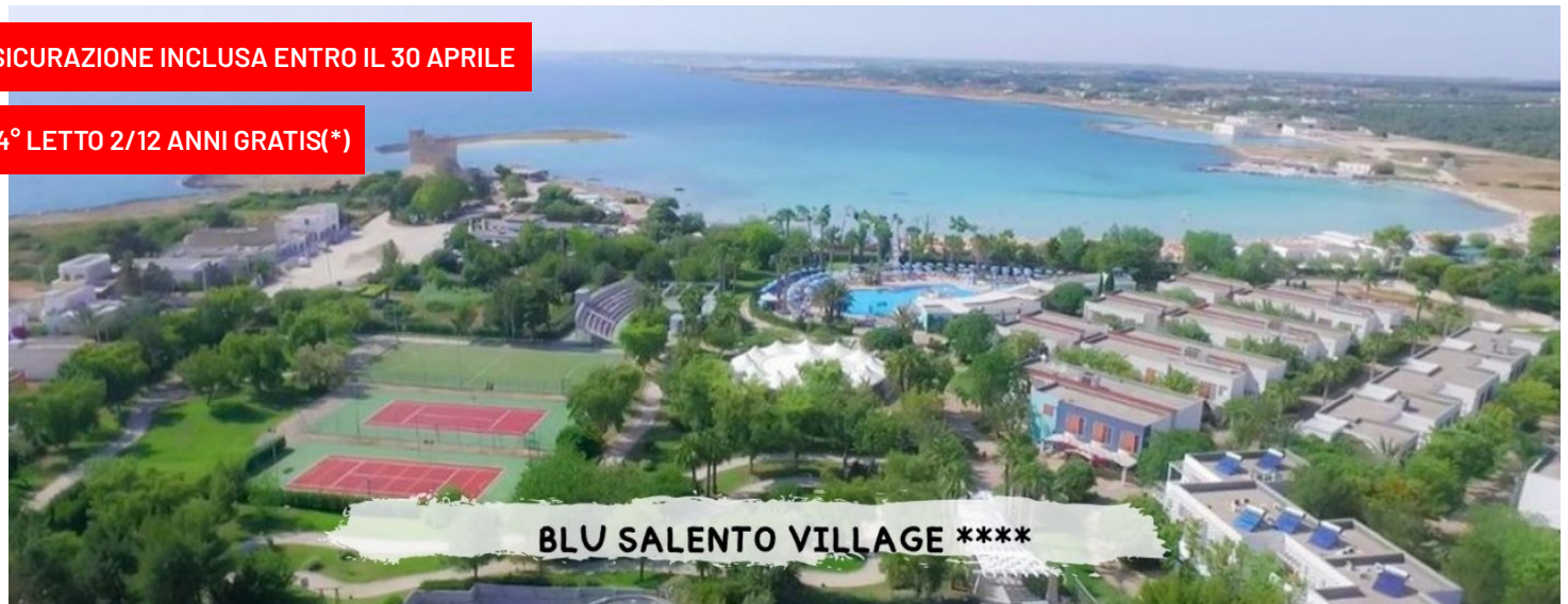
BLU SALENTO VILLAGE ****