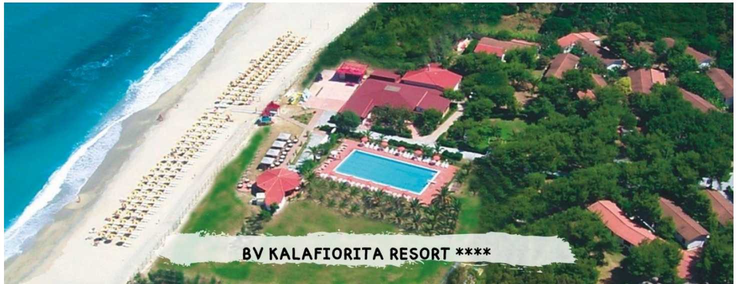
BV KALAFIORITA RESORT ****