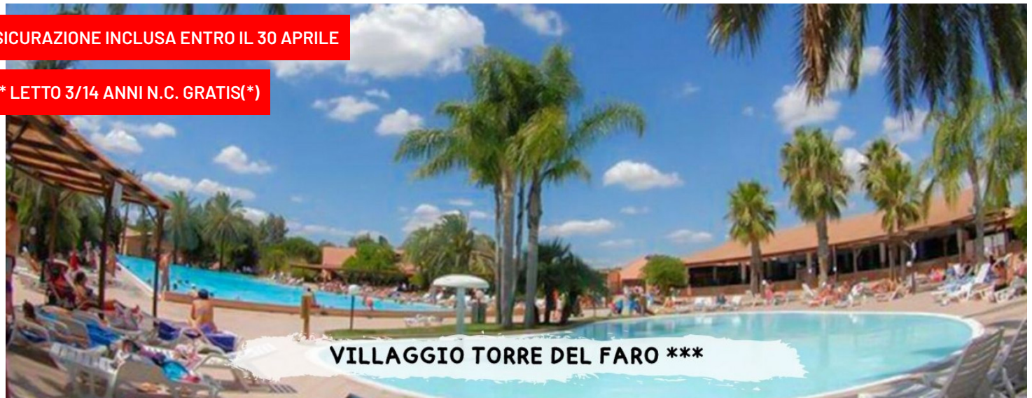
VILLAGGIO TORRE DEL FARO ***

quote a persona in pensione completa - bevande incluse in formula "mondotondo club"