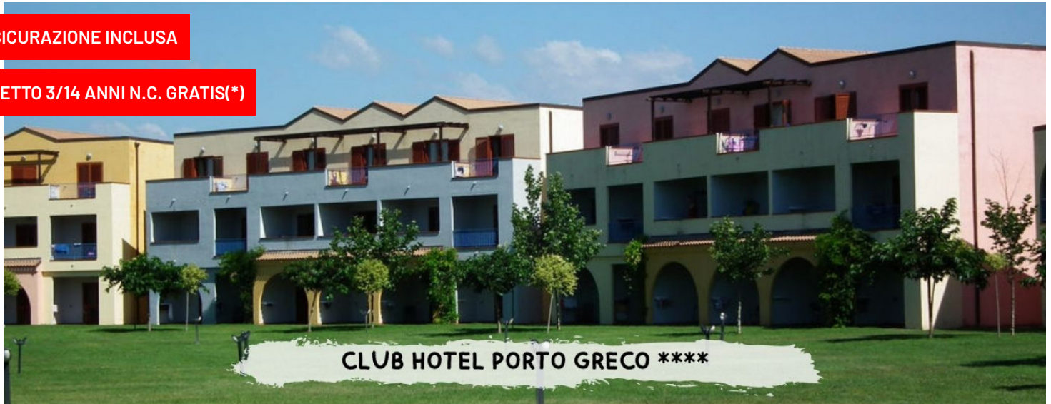
CLUB HOTEL PORTO GRECO ****