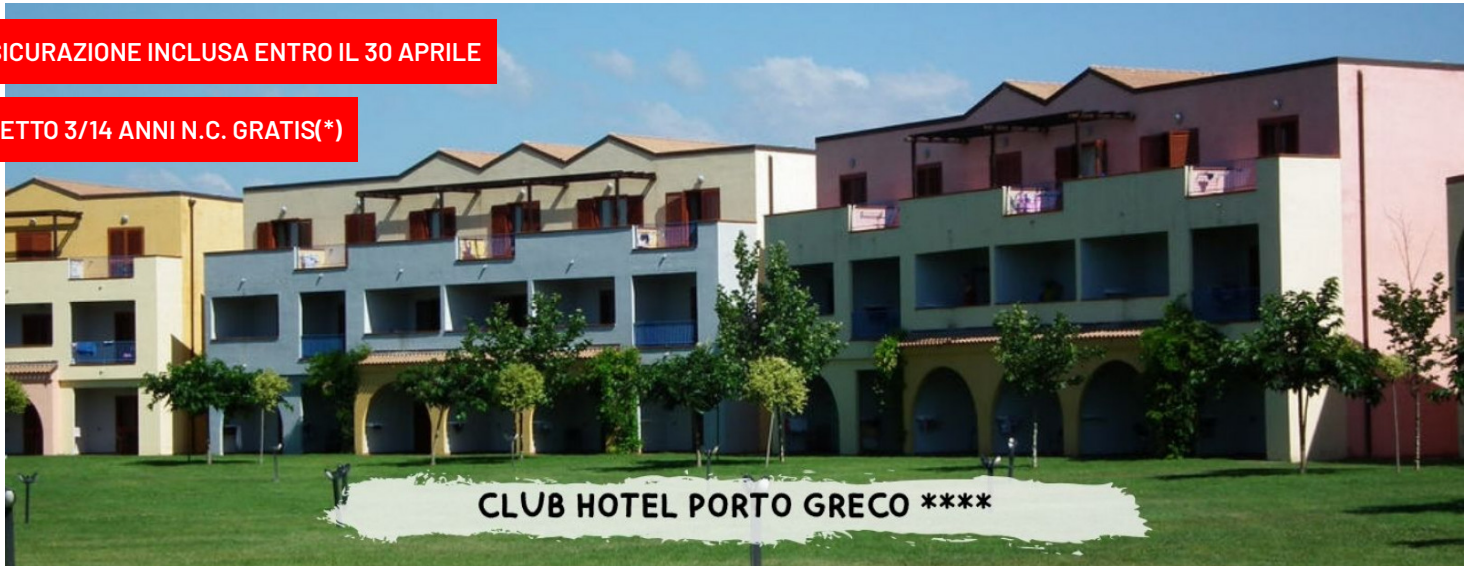
CLUB HOTEL PORTO GRECO ****

quote a persona in pensione completa - bevande incluse in formula "mondotondo club"