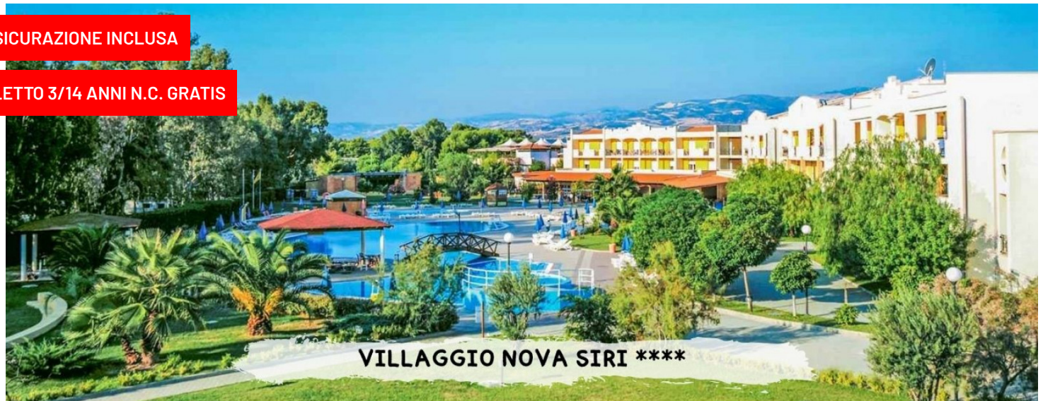
VILLAGGIO NOVA SIRI ****

quote a persona in pensione completa con soft all inclusive