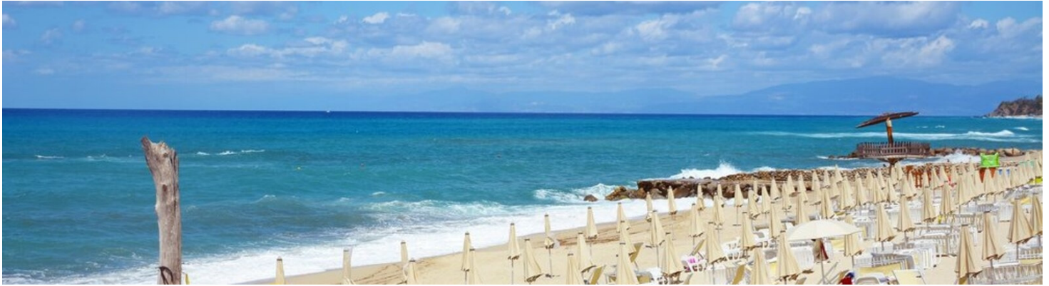
Quote settimanali per persona in camera Classic Vista Monte in Pensione Completa